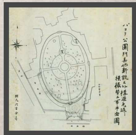
타원형의 탑골공원 (1912년 평면도)