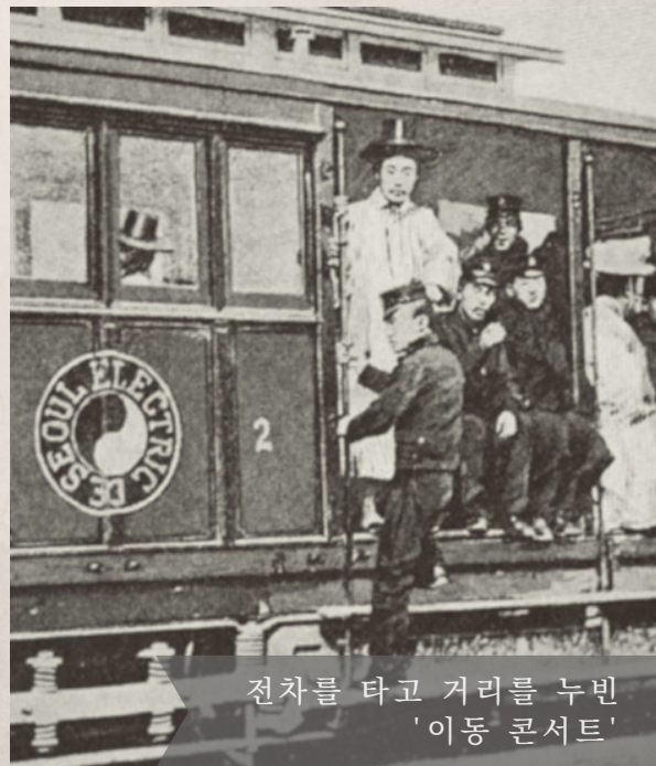
전차를 타고 거리를 누빈 '이동 콘서트'