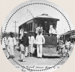
전차 앞 서울시민들