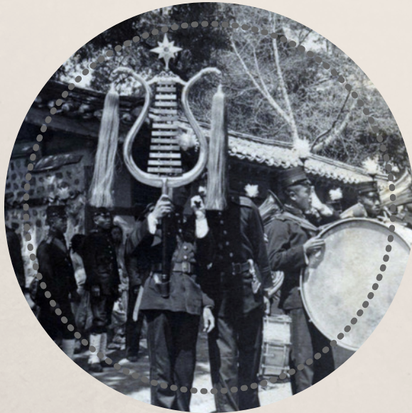
리라벨을 든 양악대