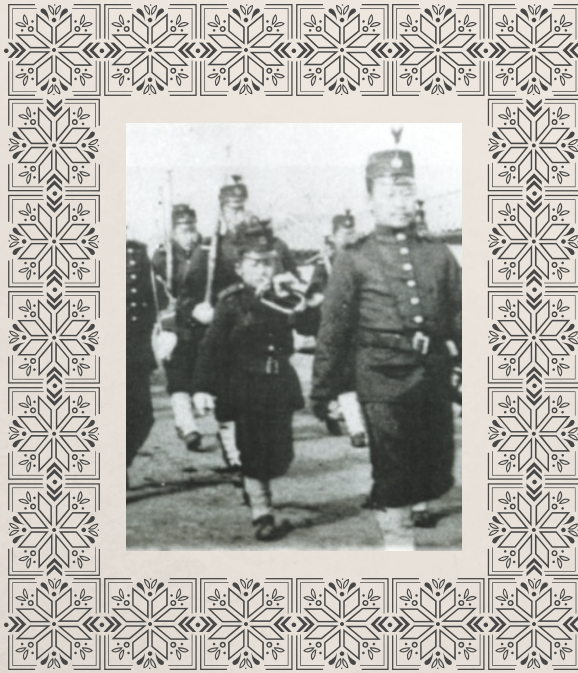
행진하는 대한제국 군악대