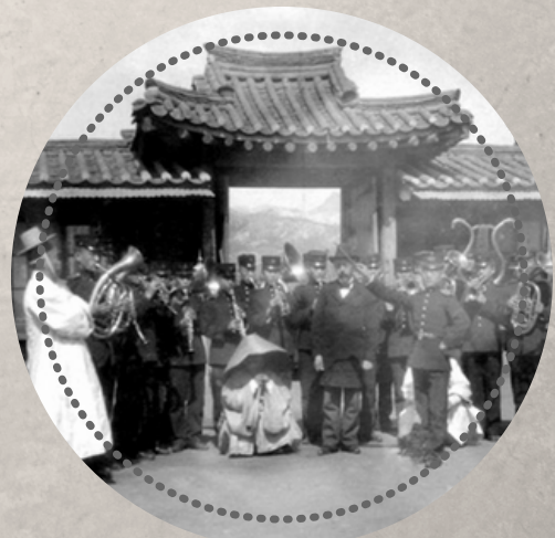
군악대 막사 문 앞에 선 양악대 일동

“(궁에 초대되어) 식사를 기다리는데 황제의 악대가 연주하여 여흥을 돋우었다. 유럽풍의 옷을 완벽하게 갖추어 입은 30여 명의 악사들로 이루어진 악단은 훌륭한 독일인 지휘자 프란츠 에케르트 지휘로 연주하였다. (중략) 그는 한국의 국가를 작곡하였으며 2년간 부지런하고 끈기 있는 작업을 통해 이 악단을 결성하게 되었는데 우리나라(이태리)의 지방에서 연주하는 많은 악단들 못지않았다. 약 한 시간 정도 계속되는 음악 감상에는 대신들과 외교관들, 통역관이 함께 자리를 하였다.” (1900~1902년 서울에서 근무한 이태리 외교관, 까를로 로제티의 〈한국과 한국인〉)