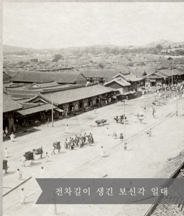
전차길이 생긴 보신각 일대